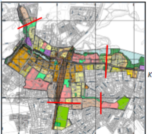
Kommunedelplan for Bryne sentrum 2015-2026

Ønske om å redusera området kor sentrumsplanen skal gjelda, blei allereie omtalt ved behandling av sentrumsplanen. Grunna plantekniske årsaker har det ikkje vore mogleg å gjera dette før etter at Kommuneplanen 2018-2030, Fase 1, blei vedtatt. Avgrensinga vil òg bli endra i temakarta. Endringa er av teknisk art. Det vil bli føretatt ein kvalitetssikring for å sjå om alle relevante føresegner, retningslinjer og omsynssoner, som t.d. vil kunna gjelda kulturminne, er tatt inn i overordna kommuneplan.